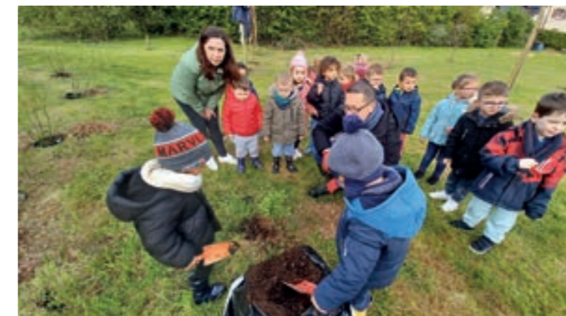
L'école maternelle a fait des plantations au Parc Vallès

Benoît Lebigre, décédé le 12 février 2024