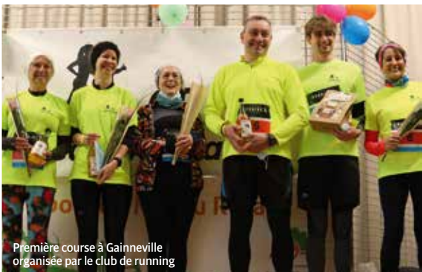
Première course à Gainneville organisée par le club de running