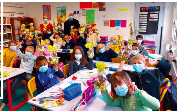
Distribution de chocolats de Pâques à l'école