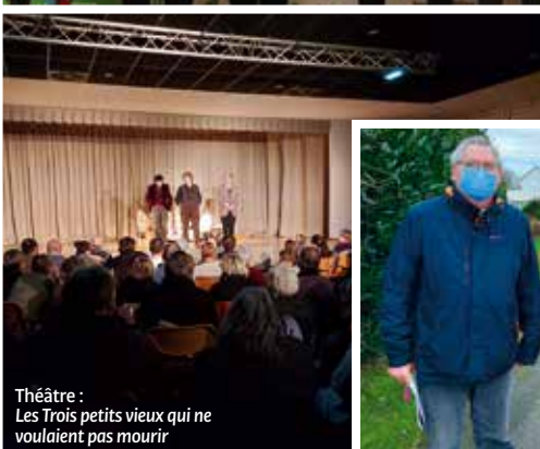
Théâtre : Les Trois petits vieux qui ne voulaient pas mourir