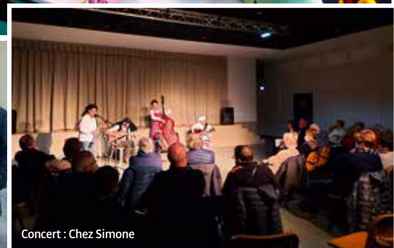
Concert : Chez Simone