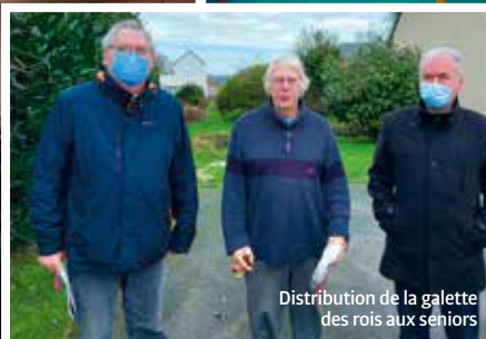
Distribution de la galette des rois aux seniors