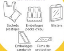
Sachets plastique Emballages packs d'eau Blisters Emballages sandwich Films de protection