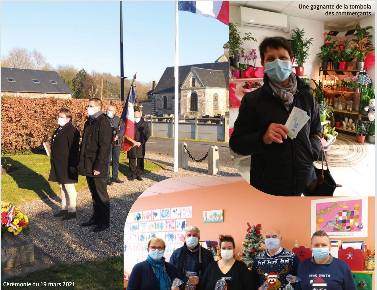
Une gagnante de la tombola des commerçants