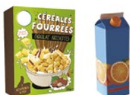
Les emballages en carton