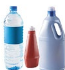
Les bouteilles et les flacons