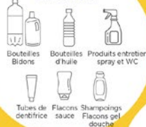
Bouteilles Bidons Produits entretien spray et WC Tubes de dentifrice Flacons sauce Shampoings Flacons gel douche