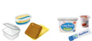
Les pots et barquettes