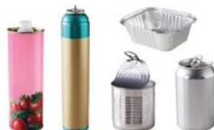
Les emballages en métal