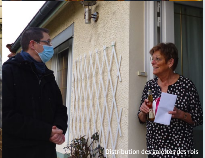
Distribution des galettes des rois