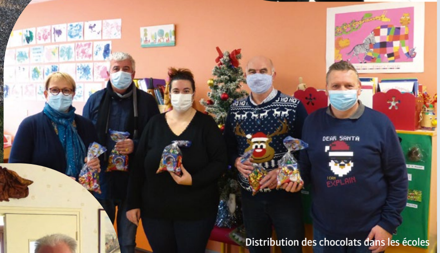
Distribution des chocolats dans les écoles