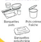
Barquettes pots Pots crème fraîche Barquettes polystyrène